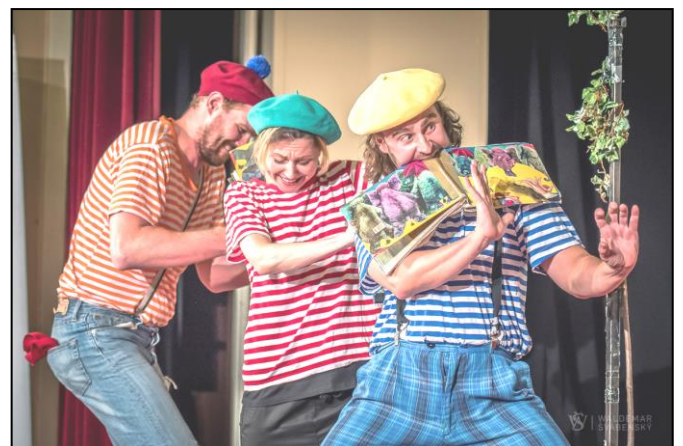
Herci souboru Listování předvedli scénické čtení z knížky Zahrada od Jiřího Trnky.