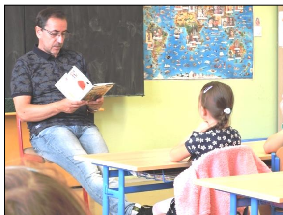
Starší děti četly mladším spolužákům v Brně-Závodí. V ZŠ J. Valčíka v Ostravě četl dětem pan ředitel.