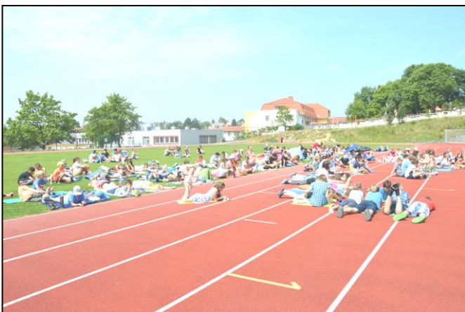
Místostarostka Prahy 14 předčítá malým posluchačům.