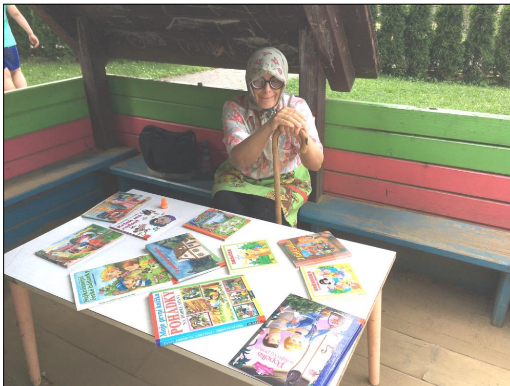
Do pohádkového lesa se vydaly děti z MŠ Jablunkov.

6. Vzdělávací semináře pro rodiče, učitele či širokou veřejnost na téma blahodárného vlivu pravidelného předčítání na vývoj dítěte.